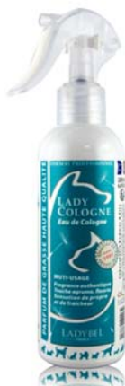
D0383 Spray - 200 ml

Ce déodorant frais et fleuri, parfum "Cologne", ne se contente pas de masquer les odeurs désagréables du pelage des animaux de compagnie ou de leurs litières, il absorbe instantanément et efficacement ces mauvaises odeurs et parfume agréablement le pelage et les locaux d'habitation où résident vos animaux. Il convient à tous les animaux de compagnie, et spécialement aux chiens et chats. C'est le secret d'une atmosphère agréable !